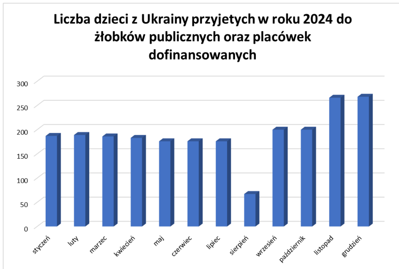
Rysunek 3 Liczba dzieci z Ukrainy przyjętych w 2024 roku do żłobków publicznych oraz placówek dofinansowanych

W pierwszym półroczu 2024 r. statystyki wskazują na stały poziom dzieci obywateli Ukrainy uczęszczających w ramach ustawy z dnia 15 maja 2024 r. o zmianie ustawy o pomocy obywatelom Ukrainy w związku z konfliktem zbrojnym na terytorium tego państwa oraz niektórych innych ustaw (Dz. U. z 2024 r. poz. 167, 232 i 834) korzystających ze żłobków publicznych oraz placówek dofinansowanych przez m.st. Warszawę. Dane na wykresie wskazują, że liczba dzieci uczęszczających do żłobka od września- w ramach rekrutacji podstawowej widocznie wzrosła.